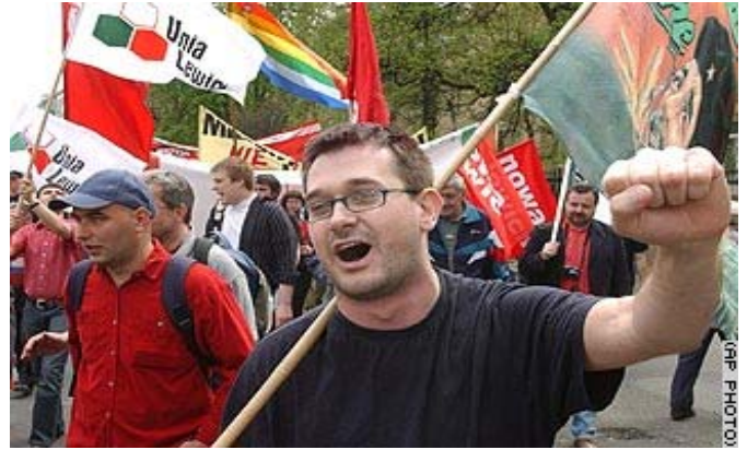
له پۆله نندا: خواستی کهمکردنه وهی ریژهی بیکاری، بهرز کردیه وه که ریژهی بیکاری ۱۹,۳% دهیبت.