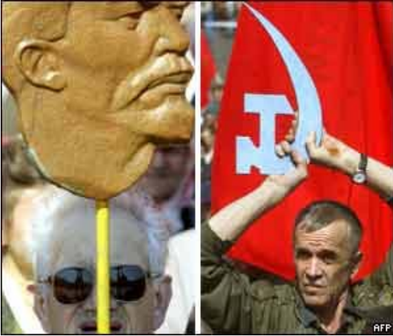
ئوکرانیا: بهرز کردنه وهی سومبیل و رمزی کۆمۆنیزم که له وولاته دا زاله له بهرامبهر دهوله تدا.