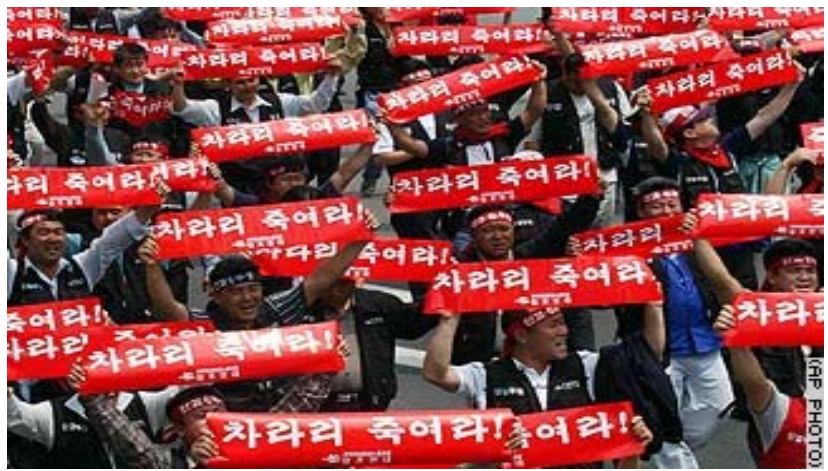
ئایاری ۲۰۰۵ له کۆریای جنووبی کریکارانی کۆریای جنووبی: بەبەرزکردنەوهی پەرچەمی داواکاری کەمکردنەوهی سەعاتی کارکردن و باشکردنی وهزعی کریکارانن ای ئایاریان سازدا.