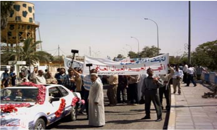
ئایاری ۲۰۰۵ له عیراق - بصره

ئایاری ئەمساڵ تاییه تمه ندیه کی بهرچاوی هه بوو، ئەمەش چ بۆ خودی چینی کریکارو کۆمۆنیزمی کریکاری ناتوانیت ئیی بگۆزهریت و ناوریکی جدی لینه داته وه، به تاییه ت بونی گرایشی کۆمۆنیستی به جزورو ریزیکی گه وره و فراوان و بهرچا و مه وجود بووه، ههر له وهی کریکارانی زۆربهی وولاتان له جیهاندا به شیعارو خواستی صنفی، رادیکال، سۆسیالیستییه وه