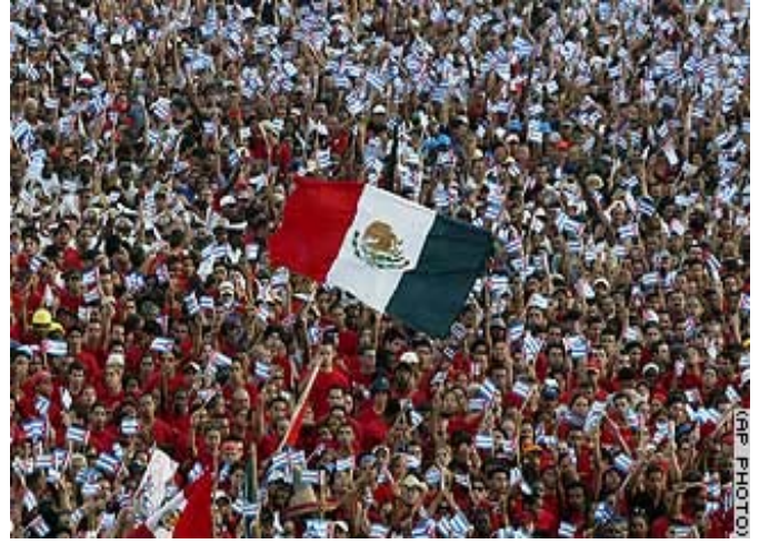
کوبا: له رۆژی ای ئایاردا ههزاران کەس رژانه سهه شه قامه کان بۆ نه وهی رۆژی هاو پشته جیهانی چینی کریکار ریز بگرن.