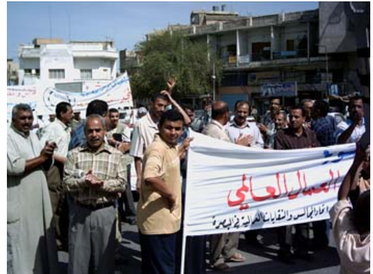
ای ئایاری ۲۰۰۵ ئە بەصرە