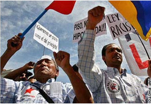
ئیسپانیا: کریکاران خواستی باشکردنی وهزعی بیکاران و وهزعی کۆمهلایه تیان بهرز کردبووه.