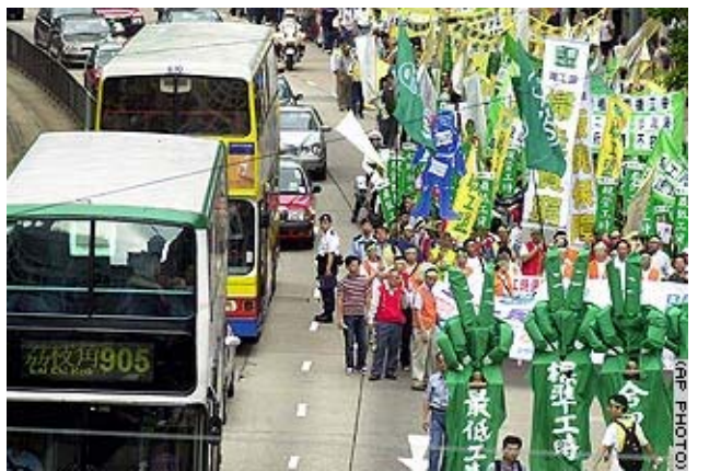
کریکارانی هۆنگ کۆنگ: داواکاری دیاریکردنی سەعات کاری خوازراو دهکەن.

ئەلمانیا: زیاتر له ۵۰۰ هەزار له فعالینی ئیتحادیه کریکاریهکان رژنانه سەر شەقامهکان خواسته کانی کریکارانیان بهرووی دهولهتدا بهرز کردوه.