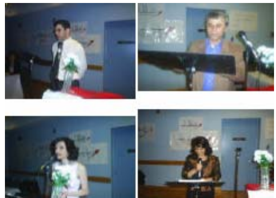
که نه دا