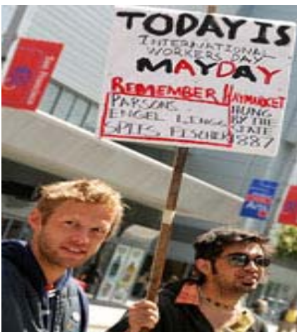
ئایاری ۲۰۰۵ له ئەمریکا - سانفرانسیسکو داواکاری: حەقی کریکاری، دیفاع له کریکارانی مهاجر و بەدژی سیاسەتی شەرخوازی ئەمریکا