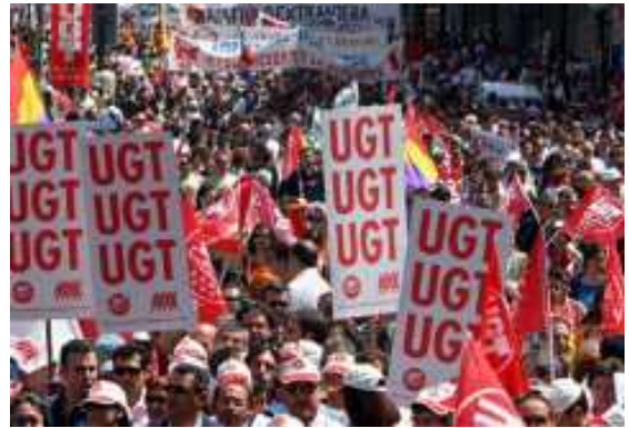
مدريد: باشکردنی وهزعی کۆمهلايهتی.....