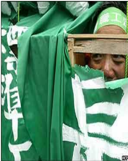
هۆنگ کۆنگ: داوا دیاریکردنی لانی کەمی کری ئە کەن.