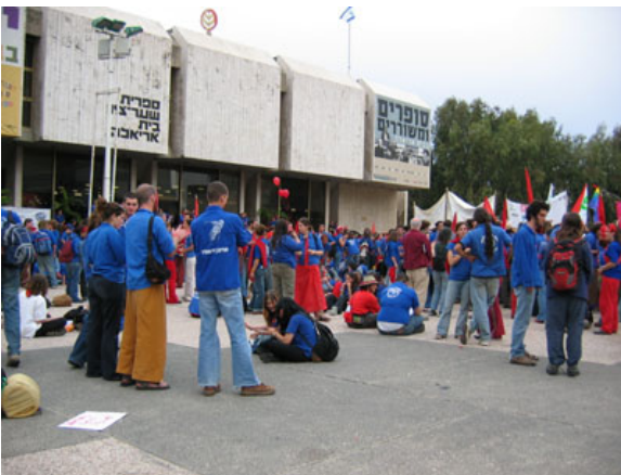
ئایاری ۵-۲ له ئیسرائیل