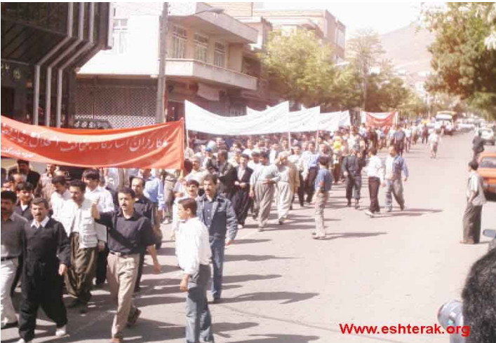
ئایاری ۲۰۰۵ له ئیران - سنه

بزو تنه وهی کۆمۆنیزی کریکاریدا نیشانداده، چه ره که تی کریکارن له ئایاری ئەمساڵدا