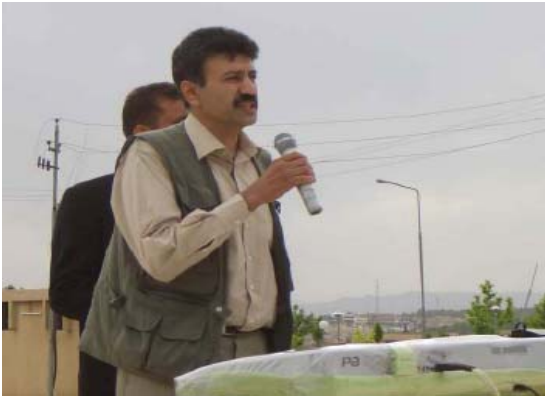
ای ئایاری ۲۰۰۵ ئە سلیمانی

http://www.wpiraq.net/kurdish/archive/may2005.htm