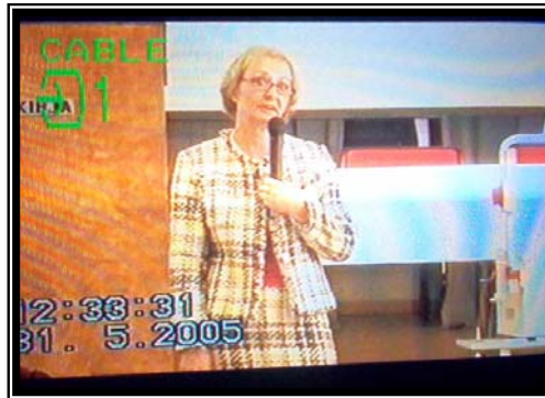
ریت نورمی لیپرسراوی یەکیژی ژنانی مۆنیکا