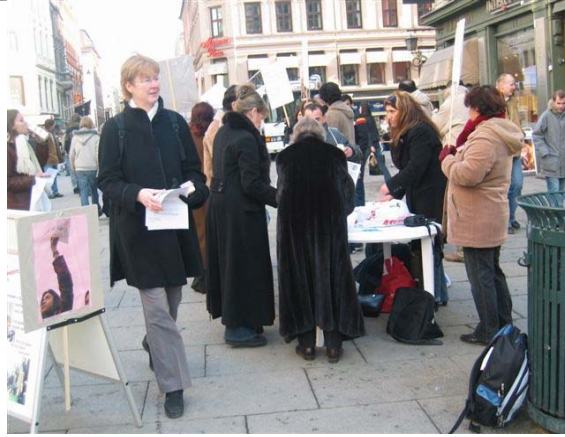
پيکيتى پوژانى 4 و 5 ى مارسى ئوسلو