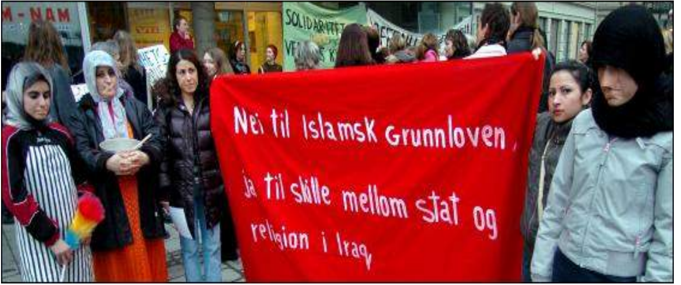
رېڊيوانى شارى فرېڊريڪستاد