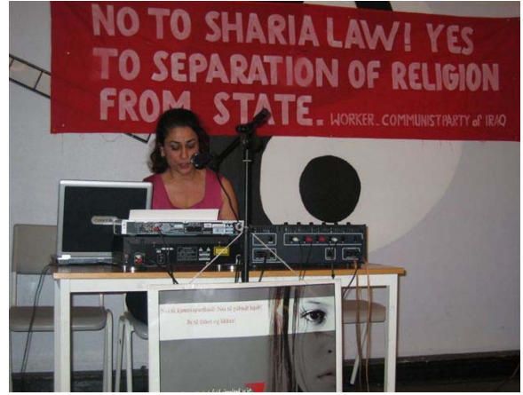
ئاھەنگى ئىۋارى 5 ى مارس لە ئۆسلۆ